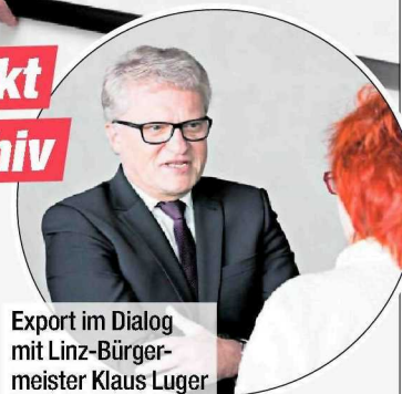
Export im Dialog mit Linz-Bürgermeister Klaus Luger

Dieses wird dann Teil des „Valie Export Centers“, das am 10. November in der Tabakfabrik eröffnet. Das internationale Forschungszentrum für Medien- und Performancekunst ist eine Kooperation der Stadt Linz mit der